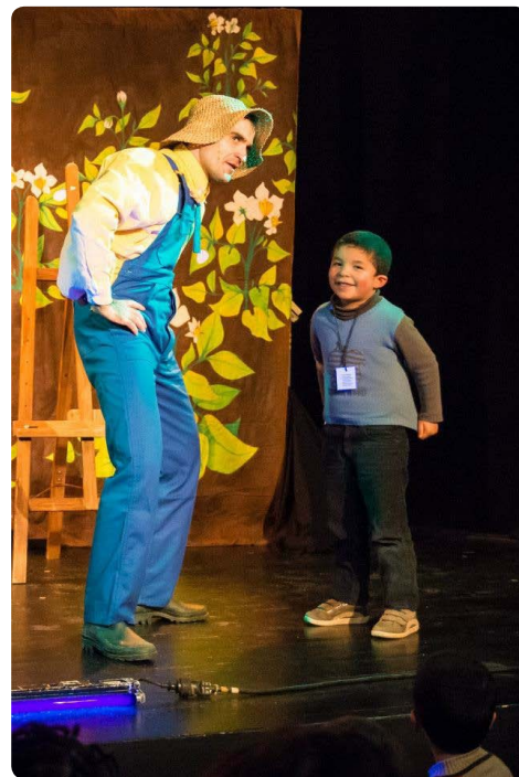
Scène d'interaction - Spectacle Croque Patate à l'attaque

La compagnie Micado s'efforce de construire des histoires simples avec des enjeux clairs, des intrigues truculentes et de multiples rebondissements pour surprendre et captiver les enfants.