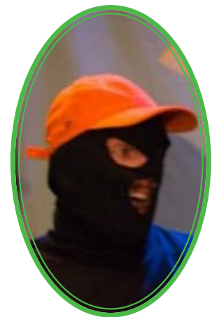
BERNARD LE CANARD

Voix off. Personnage loufoque qui apporte des éléments à l'enquête.